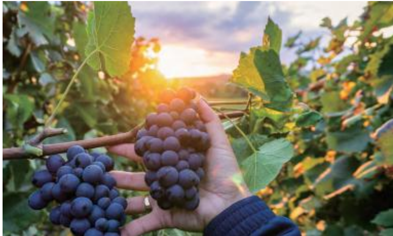
● Anggur: kulit ungu kehitaman, butiran berdaging besar, 100% tumbuh alami