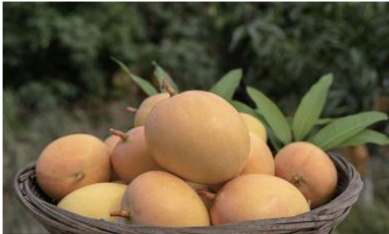
● Mangga: berair, lembut dan manis dan kaya rasa