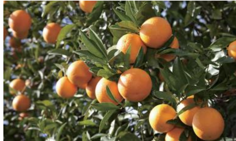
● Jeruk segar: besar dan bulat, renyah dan empuk, penuh dengan air