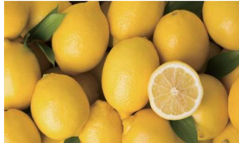
● Lemon: Vitamin C yang cukup, berair dan renyah, asam dan segar